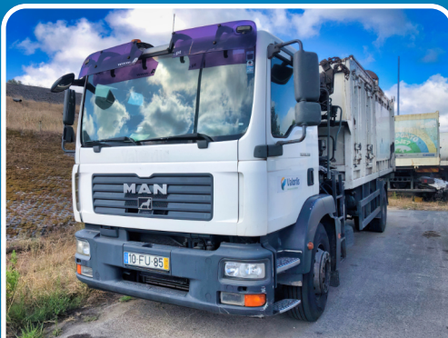
LOTE 106 2010, "MAN", Camião Grua com Caixa, Mod. TGM18.280.