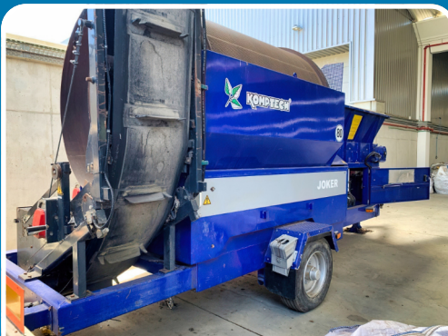
LOTE 18 2012, Crivo Móvel Composto.