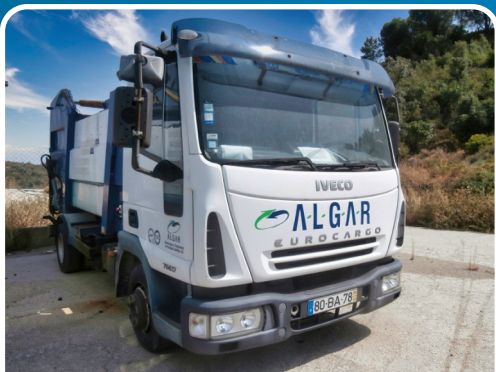
LOTE 119 2005, "IVECO", Camião Compactador Farid Minimatic 8, Mod. Eurocargó ML75E17.