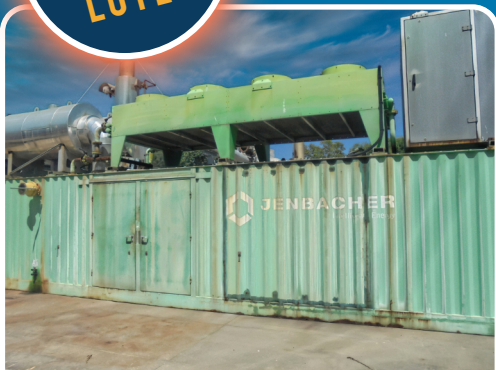
LOTE 3 2003, Grupo motorizador n.º 1 - Medidor, Queimador, Unidade de Compressão e Gerador.