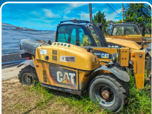
LOTE 20 2012, "CATERPILLAR", Multifunções, Mod. TH255.