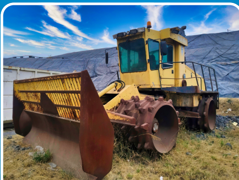
LOTE 143 2004, "BOMAG", Compactador Pitoñado, Mod. BC 672 (PAL).