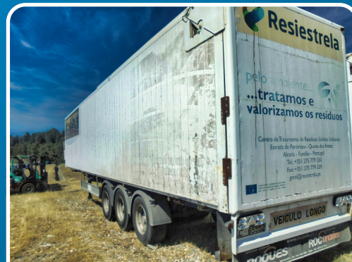
LOTE 169 2006, Semi-Reboque c/ Piso Móvel.