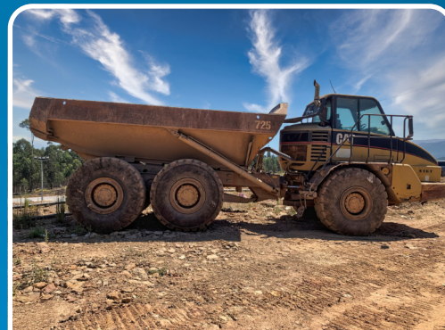
LOTE 87 2002, "CATERPILLAR", Dumper, Mod. 725.