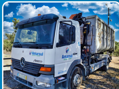
LOTE 134 2012, "MERCEDES BENZ" Camião Grua com Caixa, Mod. Atego 1523.